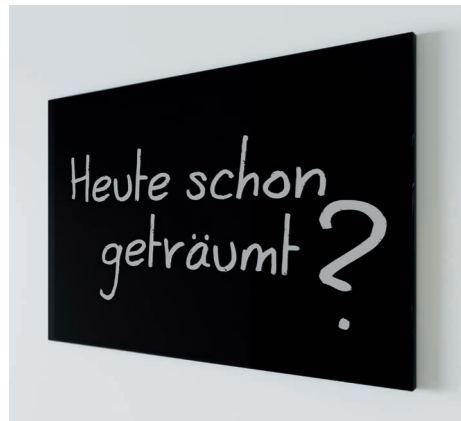
Glastafel zum Beschreiben mit handelsüblichen Kreidestiften Nr. 18020 inkl. Stift mit Halterung