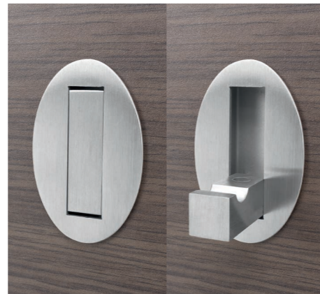
Garderobenhaken oval mit Magnetzuhaltung Nr. 70638