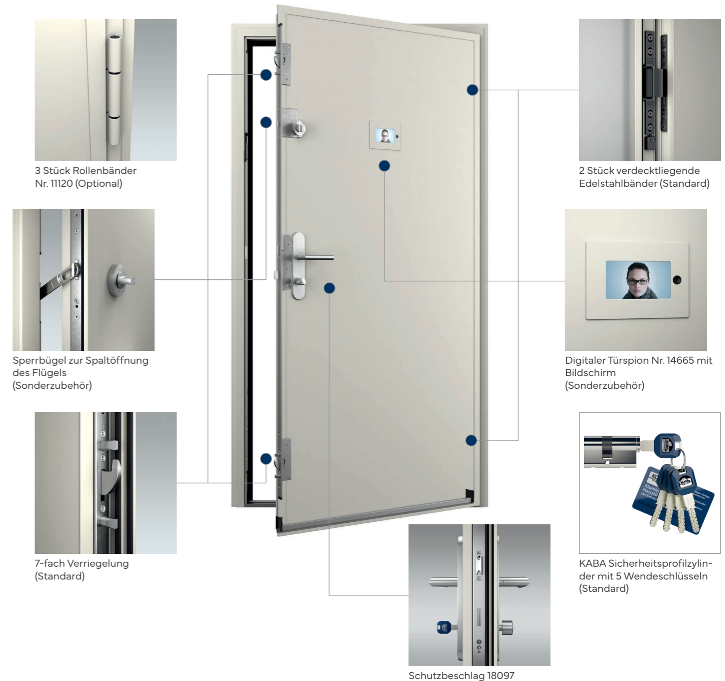
3 Stück Rollenbänder Nr. 11120 (Optional)