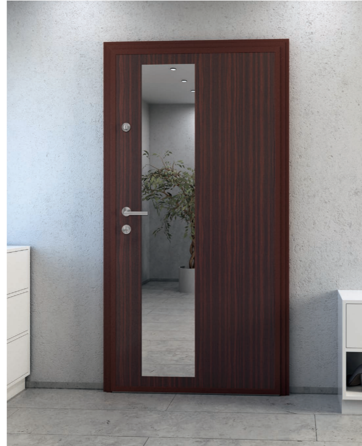
Spiegelstreifen auf der Innenseite Nr. 18010