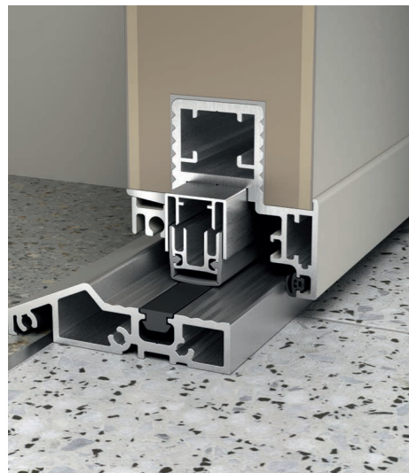
Aluminium-Bodenschwelle mit absenkbarer Bodendichtung Standard (ohne Mehrpreis)