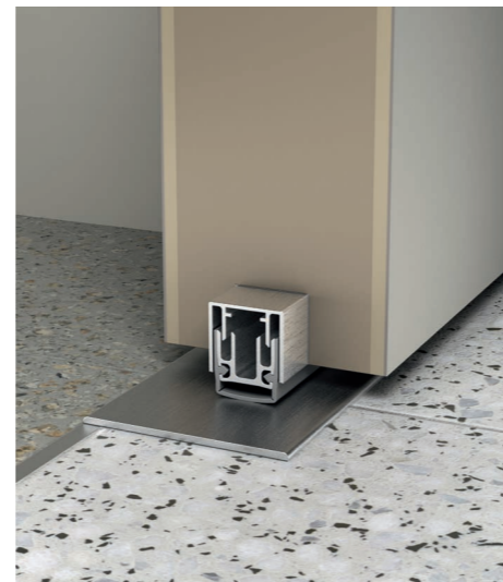
Absenkbare Bodendichtung ohne Schwelle (ohne Mehrpreis)

Die Ausführung als Schallschutztür (Rp = 44 dB) ist nur mit dieser Schwelenausführung möglich.