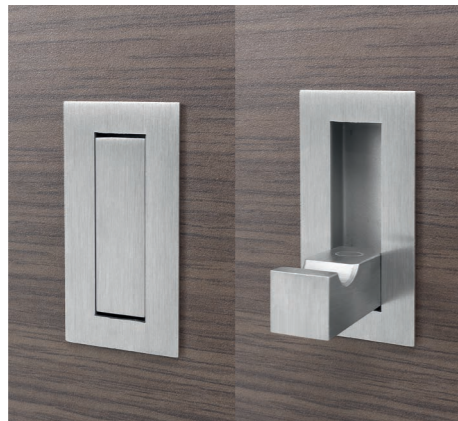
Garderobenhaken rechteckig mit Magnetzuhaltung Nr. 70637