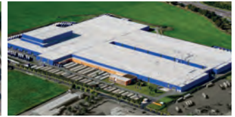
Hörmann KG Ichtershausen, Deutschland