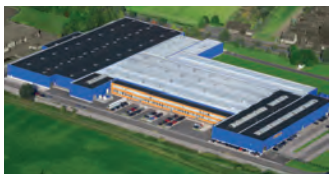
Hörmann KG Werne, Deutschland