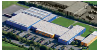
Hörmann KG Antriebstechnik, Deutschland