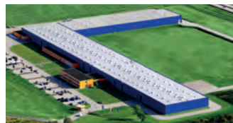
Hörmann Legnica Sp. z o.o., Polen