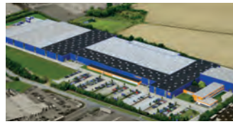
Hörmann KG Brandis, Deutschland