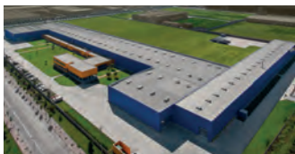
Hörmann Tianjin, China