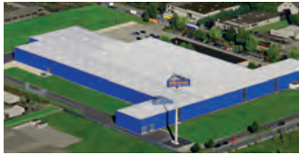
Hörmann KG Dissen, Deutschland