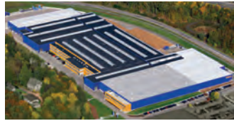
Hörmann KG Eckelhausen, Deutschland