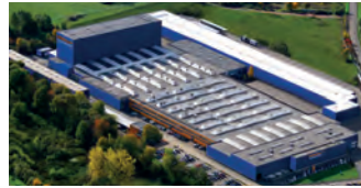
Hörmann KG Freisen, Deutschland