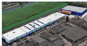
Hörmann Alkmaar B.V., Niederlande