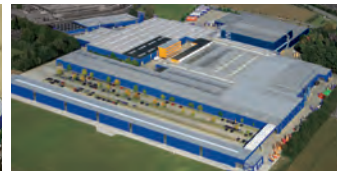
Hörmann KG Brockhagen, Deutschland