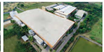
Shakti Hörmann Pvt. Ltd., Indien

Als einziger Hersteller auf dem internationalen Markt bietet die Hörmann Gruppe alle wichtigen Bauelemente aus einer Hand. Sie werden in hochspezialisierten Werken nach dem neuesten Stand der Technik gefertigt. Durch das flächendeckende Vertriebs- und Servicenetz in Europa und die Präsenz in Amerika und Asien ist Hörmann Ihr starker, internationaler Partner für hochwertige Bauelemente. In einer Qualität ohne Kompromisse.