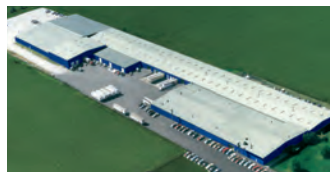
Hörmann LLC, Montgomery IL, USA