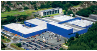
Hörmann KG Amshausen, Deutschland