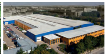
Hörmann Beijing, China